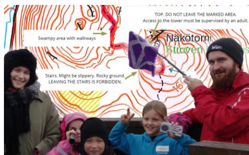
Figur 1: Fra finsk undervisningsprosjekt

Gode ambassadører for verdensarven Struves meridianbue må finnes i lokalsamfunnene. Det er viktig å nå ut med kunnskap og forståelse for oppmålingen av meridianbuen. Å kombinere kunnskap om UNESCO, metode, vitenskapshistorien og ekspedisjonshistoriene med stedenes historie kan sikre at verdensarven ivaretas for framtidens generasjoner.