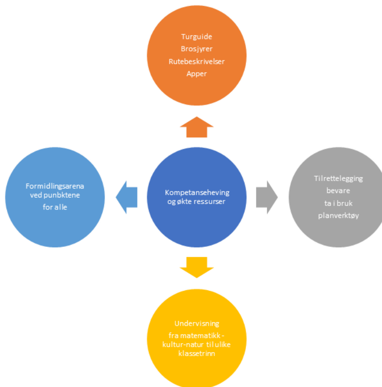
Figur 8: Kompetanseheving og økte ressurser kan føre til flere nødvendige tiltak

1.utkast av Formidlingsplanen ble tatt til etterretning av Verdensarvrådet 29.4.19- da det var siste rådsmøte før Fylkesting- og kommunevalg i 2019. Dette eksemplarer bør behandles av nytt Verdensarvråd av 2020.