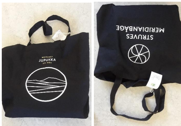
Figur 6: Veske utviklet i Nord-Sverige