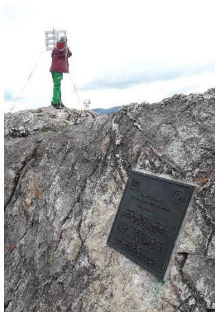
Figur 4: Fotograf G.D ved Lille Raipas

Informasjonstavlene ved startpunktene må skiftes ut. De er spekket med informasjon og denne informasjonen bør fordeles fra start til toppen.