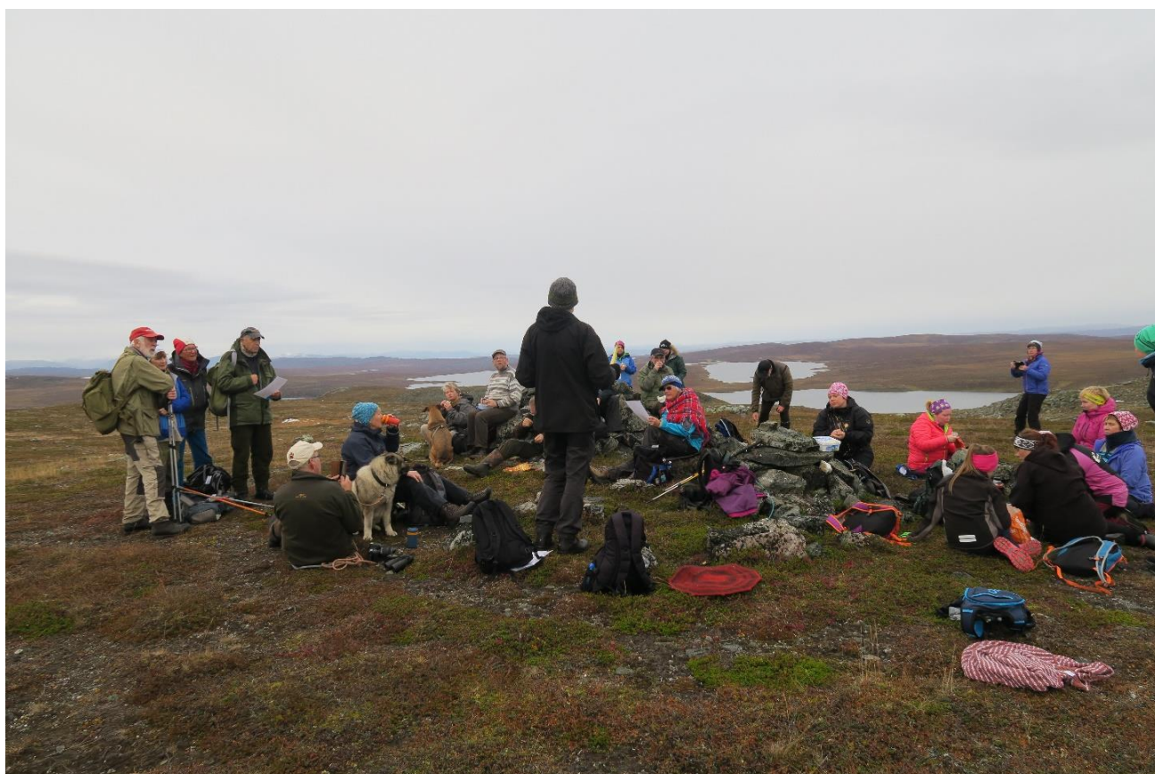
Kulturminnedagen 2017 – foredrag på Lodiken / Luvddiidčohkka.