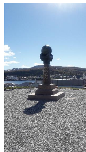
Figur 5: Meridianstøtta med nytt dekke og vokset.

Meridianstøtten i Hammerfest har laget stier for rullestolbrukere, men disse krever vedlikehold og utbedringer og rydding også om vinteren. I tillegg bør informasjon og annet være mulig for hørselshemmede og svaksynte.