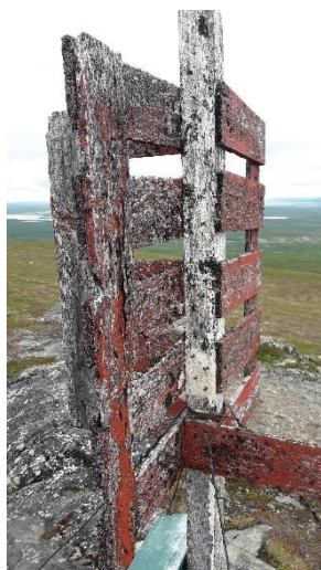
Figur 3: Nedslitt Kartmerke med postkasse Muvravarri

Finansiering: Interreg programmer, EØS samarbeid, Innovasjon Norge, regionale utviklingsmidler, egenkapital fra kommuner, reiselivsbedrifter og museer.