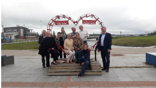
Figur 7: For-prosjekt Interreg N- Den nordligste delen av meridianbuen

Fordeling av oppgaver og ansvarsområder mellom de tre vertskommunene er en metode for å nå alle målene, men også for å utnytte maksimalt av nåværende og framtidige ressurser. Samarbeid er grunnlaget for å ivareta Struves meridianbue og vil gi mulighet til å arbeide internasjonalt.